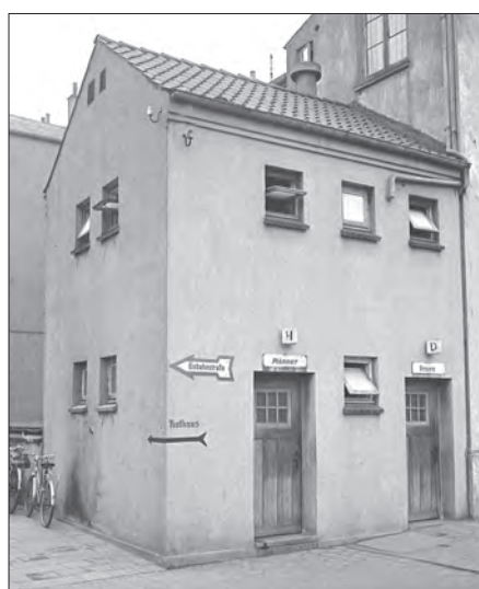
Zum Rathauseingang auf der Rückseite