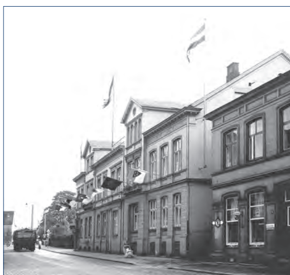
Rathaus Schulstraße 1 - 3 Fotos: E.-G. Scholz, Elmshorn, 1964