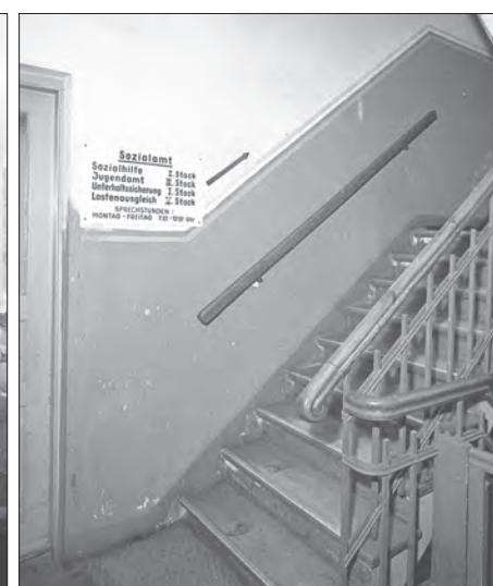
Aufgang zu Sozialhilfe und Jugendamt