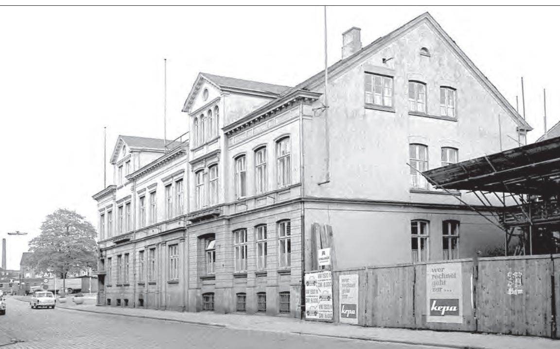
Rathaus Schulstraße 1 - 3

Dieses Haus diente dann über 70 Jahre lang – bis es 1967 abgerissen wurde – als Rathaus der Stadt.