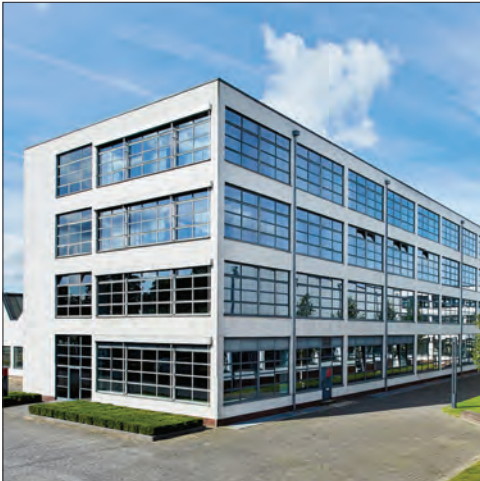
Vereinigte Seidenwebereien AG | Krefeld Architekt: Mies van der Rohe, 1931-1935

In den 1950er und 1960er Jahren wurden viele Bauwerke in Deutschland in diesem Geist entworfen und realisiert, schließlich wollte und konnte man nicht an die einschüchternde Architektursprache der Hitlerdiktatur anknüpfen.