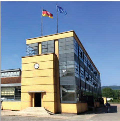
Fagus Werke | Alfeld / Leine Architekt: Walter Gropius, 1911 - 1925

Initialgeber einer funktionalen, schlichten und industriell orientierten neuen Architektursprache waren die De-Stijl-Bewegung in den Niederlanden (ab 1917) und das Bauhaus (1919-1933) als Ausbildungseinrichtung in Deutschland. Seine Direktoren Walter Gropius (1883-1969) und Ludwig Mies van der Rohe (1886-1969), wurden zu Leitfiguren der modernen Architekturszene.