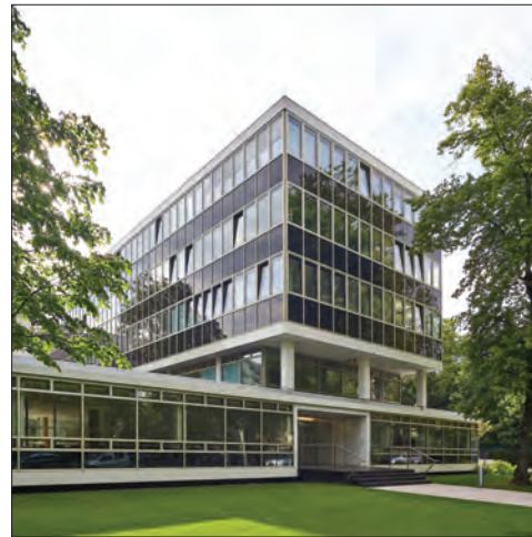
Amerikanische Generalkonsulat | Frankfurt Architekten: Skidmore, Owings and Merrill, Chicago, 1953 - 1955