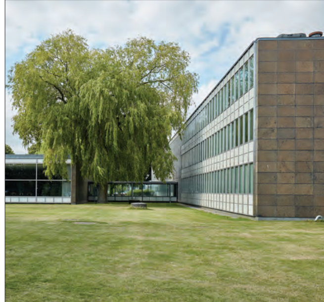
Rathaus Rødovre Architekt: Arne Jacobsen, 1954-1956