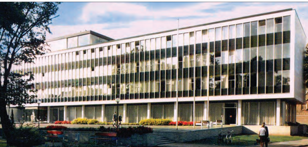
Rathaus Elmshorn | Architekten: Mensinga + Rogalla, Hamburg, 1964 - 1967

Nachdem die skandinavischen Architekten in den 1920er und 1930er Jahren nach Deutschland gereist waren, um sich stilistisch inspirieren zu lassen, kehrte sich die Reiserichtung nun um und deutsche Architekten suchten Anregung in Skandinavien.