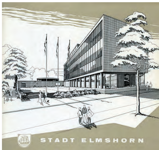
„Elmshorn hat ein neues Rathaus“ - Broschüre der Stadt Elmshorn, 1967