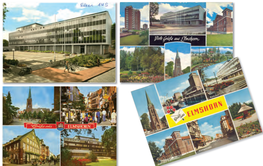
Postkarten: Papierhaus Bramstedt und Industriemuseum Elmshorn