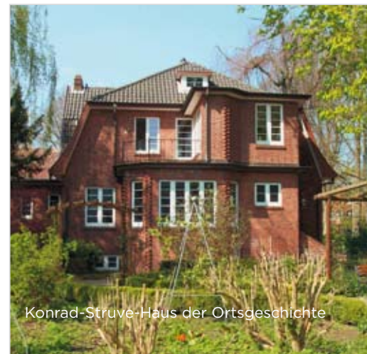
Konrad-Struve-Haus der Ortsgeschichte