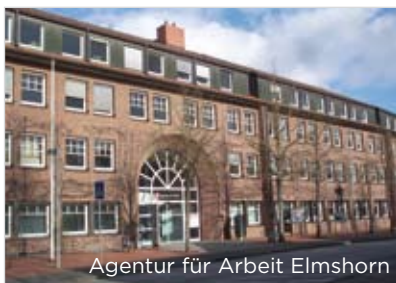
Agentur für Arbeit Elmshorn