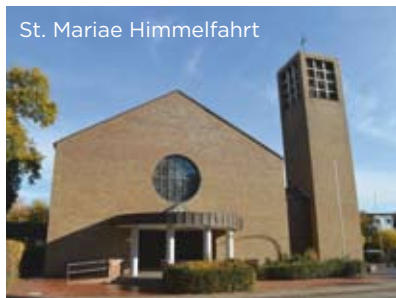
St. Mariae Himmelfahrt