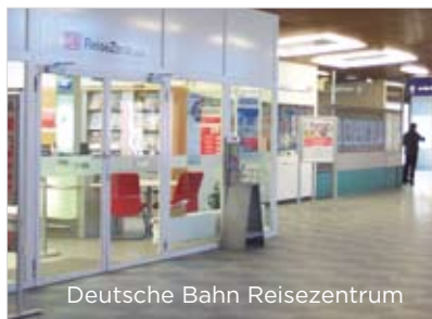
Deutsche Bahn Reisezentrum

** 20 ct/Min. aus dem Festnetz, Tarif bei Mobilfunk max. 60 ct/Min. www.bahn.de