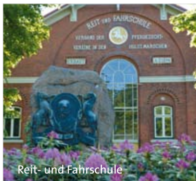
Reit- und Fahrschule

Schießen, Tischtennis, Gymnastik Damen, Hallensport