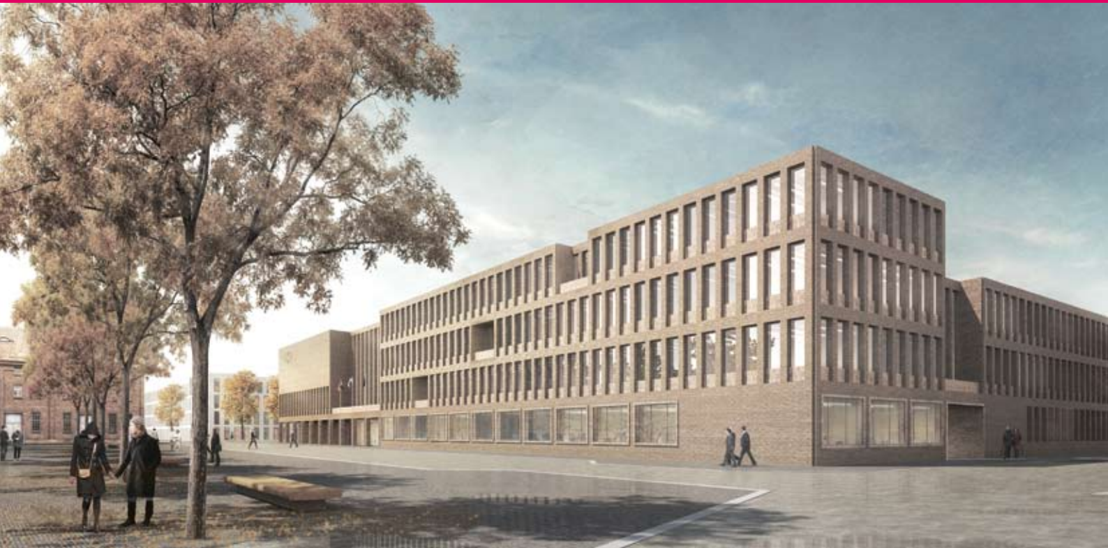
© Winking Froh Architekten BDA, Siegerentwurf des neuen Rathauses