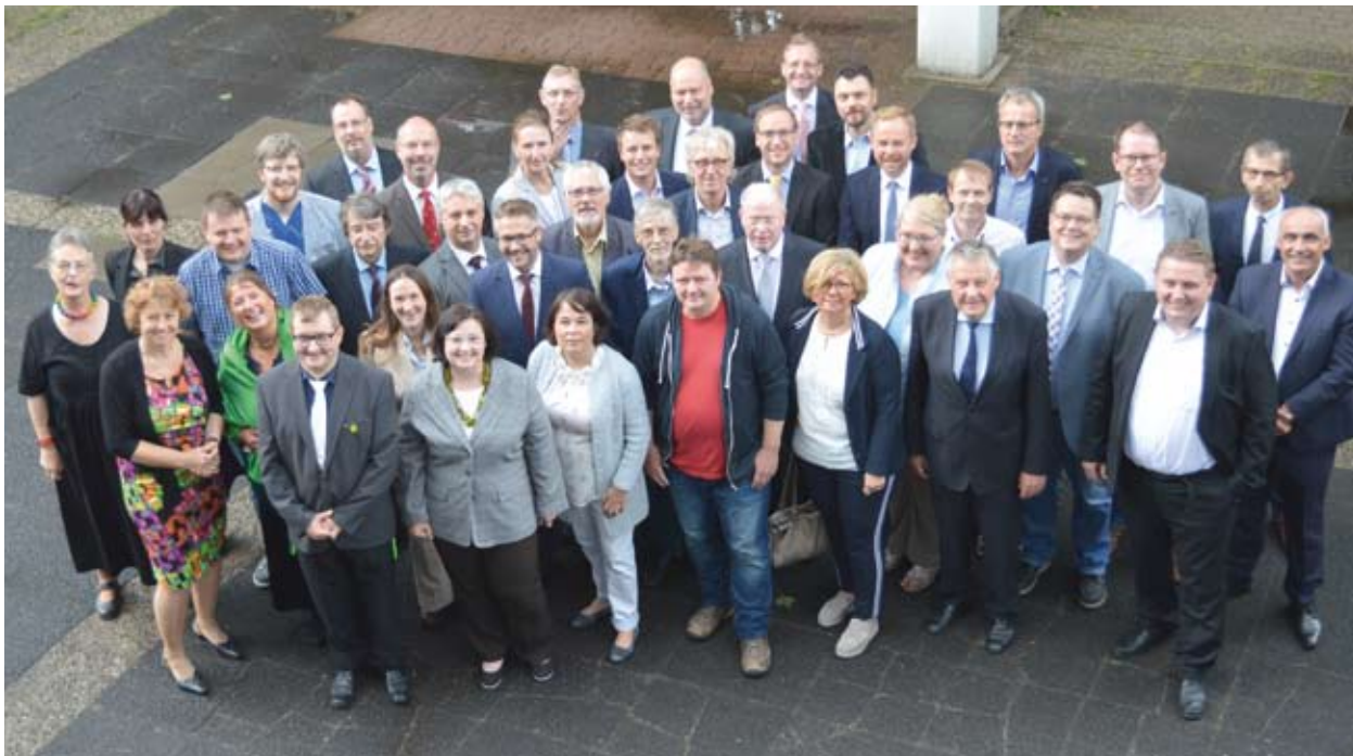
Das neugewählte Stadtverordneten-Kollegium am 26.06.2018.