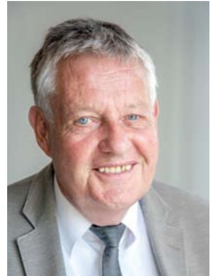
Bürgermeister Andreas Hahn

Er vertritt bei öffentlichen Anlässen das Stadtverordneten-Kollegium sowie gemeinsam mit dem Bürgermeister die Stadt. Zusätzlich leitet der Bürgermeister die jährliche Einwohnerversammlung, die von ihm einberufen wird.