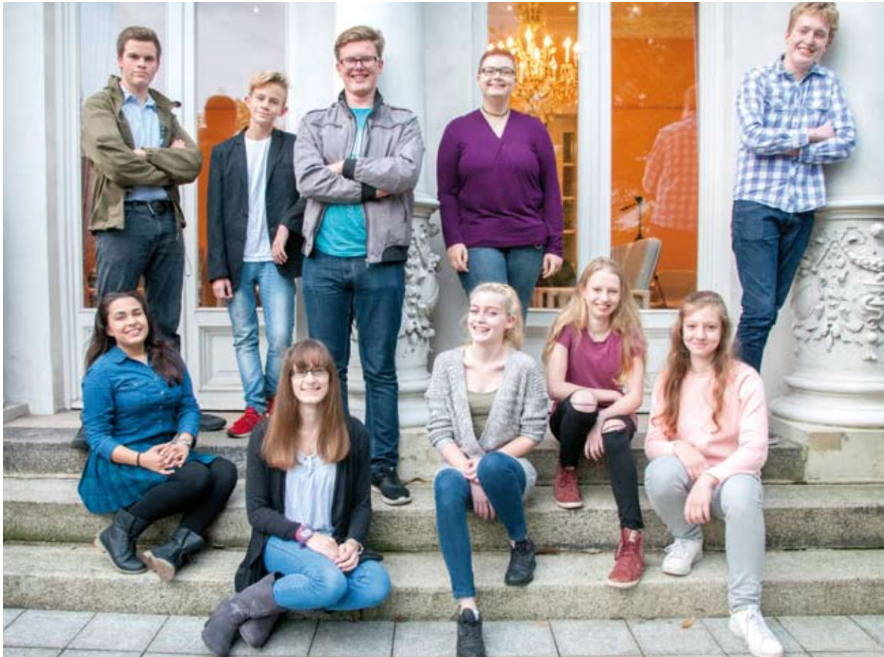
Der 12. Kinder- und Jugendbeirat