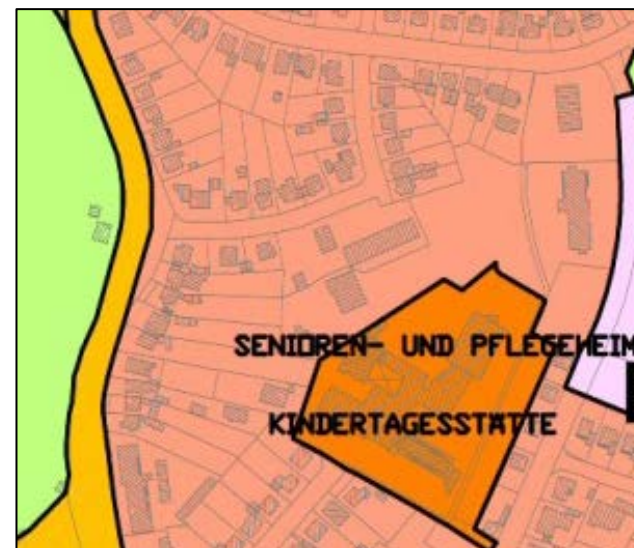
Flächennutzungsplan 2010 nach der 13. Änderung durch Berichtigung