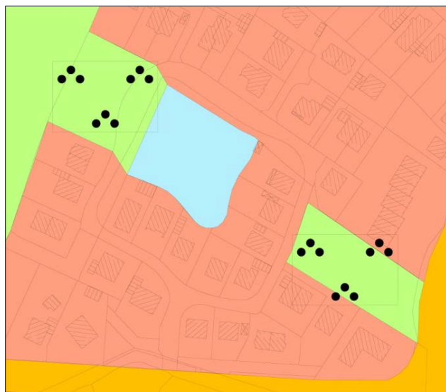
Flächennutzungsplan 2010 vor der 14. Änderung durch Berichtigung