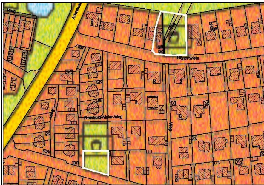
Flächennutzungsplan 2010 vor der 15. Änderung durch Berichtigung